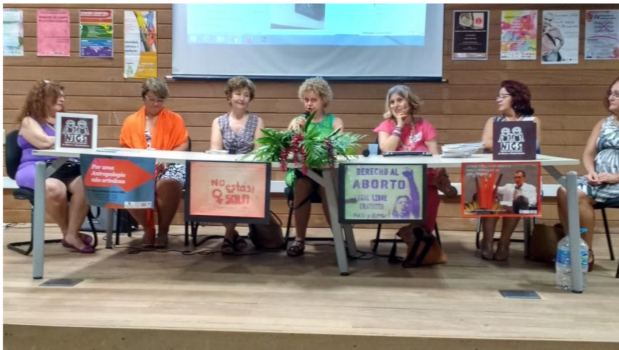
Mesa de abertura dos 25 anos do NIGS